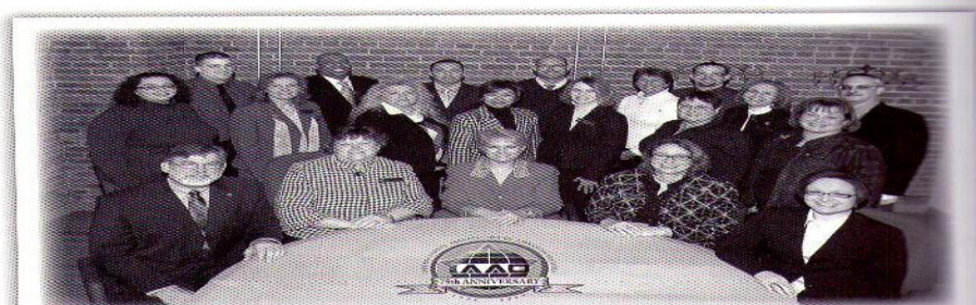
Your IAAO Staff

So how does an organization like IAAO remain viable for the next 75 years? We need to continue to hire the best staff possible to support the greatest volunteers in the world. As long as we have these two groups working together, we have a real opportunity to take IAAO to new heights, and to continue making IAAO an indispensable part of every professional assessor's career story.